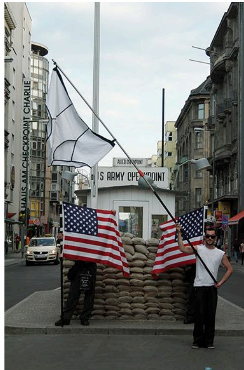
Yiannis Pappas, Nation panties (within a performance at Checkpoint Charlie, Berlin), 2011, sewed and stitched cotton, ca. 170x130 cm

Manche Dinge scheinen seit Menschengedenken unerschütterlich, wie etwa eine Festung, eingebunden in einer Landschaft. Solche Bauwerke bezeugten früher eine feste Zuversicht in die menschliche Existenz und deren Fortbestand – und können womöglich noch heute in diesem Zusammenhang gesehen werden. Doch wir sollten nicht vergessen, dass Schlösser und Burgen auch der Repräsentation von Macht und Besitzanspruch dienten und damit zuallererst strategisch gedacht waren. Aus Wildnis wurde Landschaft erschaffen.